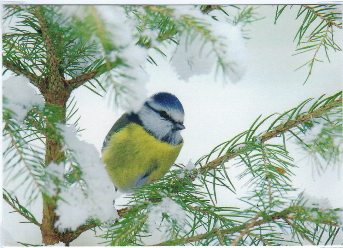
Ko sneg prekrije pokrajino je težko priti do hrane. Takrat pticam pomagamo s krmilnicami. Ko ni snega lahko pridejo do hrane.

Založba: natuur-lijkefoto.nl, postcards for postcrossing; potovana: 31. 1. 2023