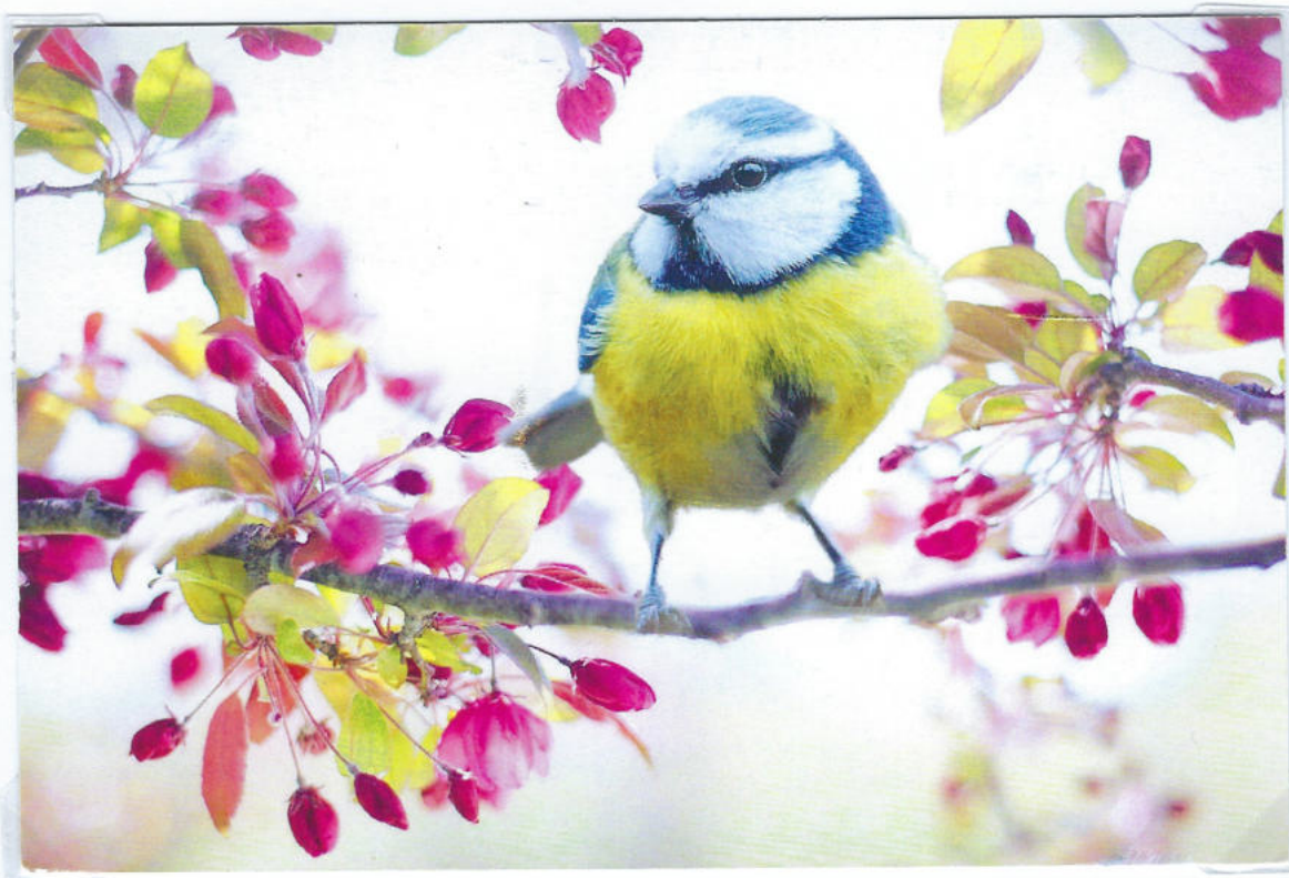
Na pomlad ptice pevke rade pridejo tja, kjer so pozimi dobivale hrano in se zahvalijo z ubranim petjem. Založba: Lazy panda card company ; potovana 23. 6. 2022