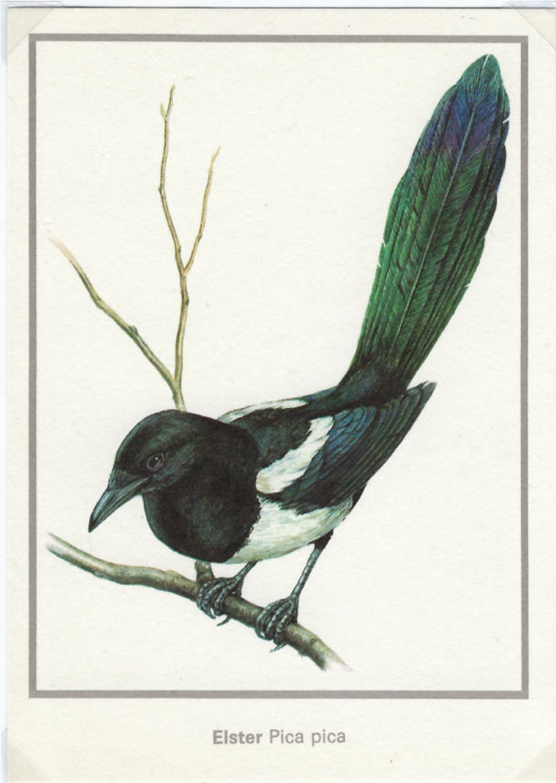
Elster Pica pica

Založba Kezdomuveszeti Alap Kiadovallalata, Budapest; grafika: Robert Muray, tisk: offse: tNyomda, Budapest