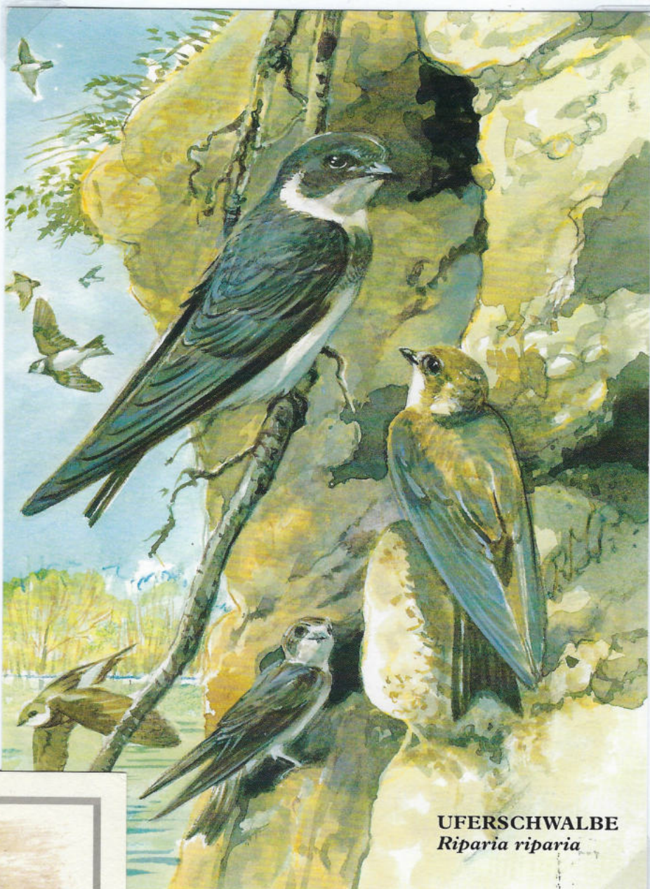
UFERSCHWALBE Riparia riparia

Založba: Ludwig Stocker Hoffpisterei GmbH, München; pekarna, ki vsak mesec izda razglednico z motivom ohranjanja naravnega okolja. Ilustrator je Rita Mühlbauer v akvarelni tehniki.