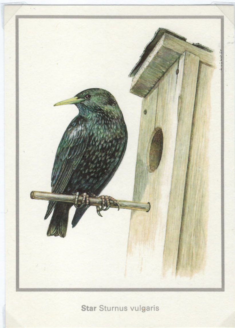
Star Sturnus vulgaris

Založba: STAR STARLING; foto Winfried Wisniewski – nemški naravoslovni fotograf, NIKKON D4