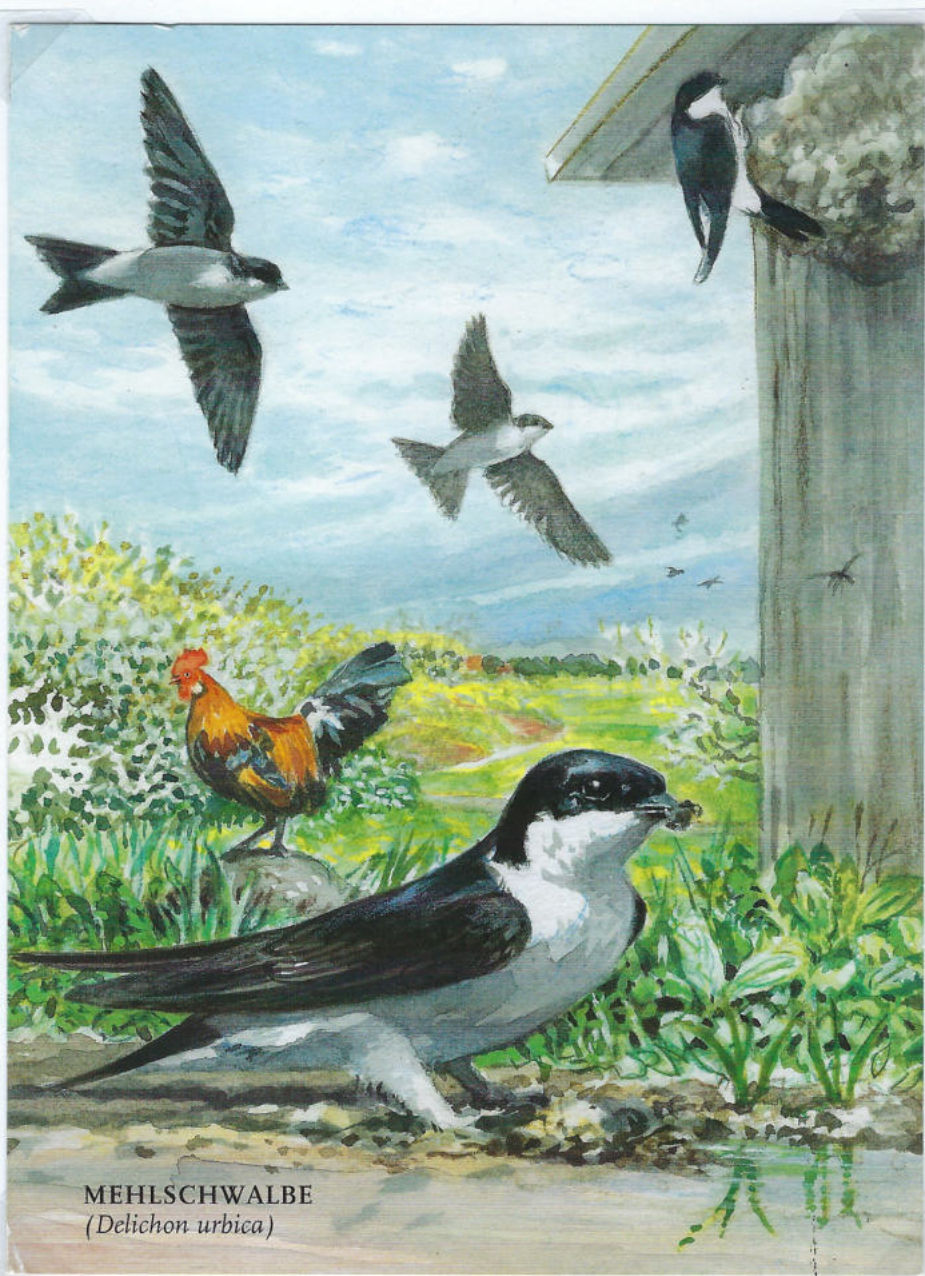
MEHLSCHWALBE ( Delichon urbica )

Založba: Ludwig Stocker Hofpfistererei GmbH, München; pekarna, ki vsak mesec izda razglednico z motivom ohranjanja naravnega okolja. Ilustrator je Rita Mühlbauer v akvarelni tehniki.