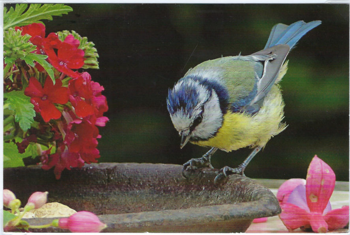
Plavček je nekoliko manjša vrsta sinice. Ima prepoznavno modro kapo. Drugače je v vsem podoben sinici. Potovana: 26. 8. 2021