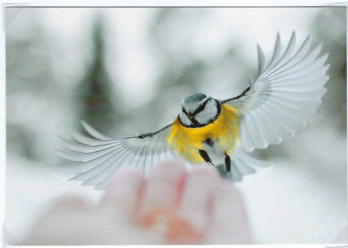
Sinice so spretni letalci. Med letov pokažejo belino letalnih peres. Založba in tisk: postmania.ru ; potovana: 8. 2. 2022