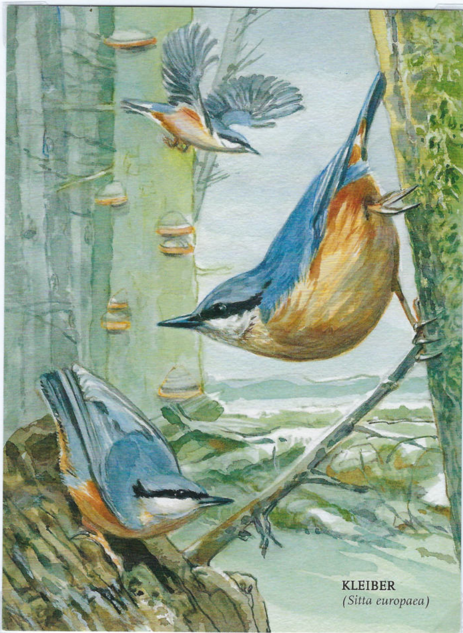
KLEIBER ( Sitta europaea )

Brglez je naša najbolj spretna ptica pri plezanju. Običajno pleza po deblu. Lahko pleza v vse smeri in tudi z glavo navzdol.