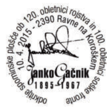
PP KFD 118/2015