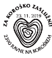
PP KFD 208/2019