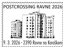
PPŽ2 - 9.3.2026

Priložnostna poštna žiga (PPŽ) - pošta 2390 Ravne na Koroškem