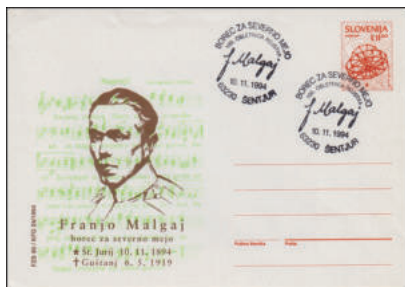
FZS 90 / KFD 24/1994

Naše skupno prizadevanje za ohranitev spomina na Franja Malgaja in njegove soborce je v letu 2019 ujela tudi Pošta Slovenije, ki je izdala priložnostno poštno znamko, žig prvega dne in spominsko ovojnico prvega dne. Priložnostna poštna znamka je bila slovesno dana v promet dne 22.3.2019. Slovesna predstavitev znamke je potekala v avli Občine Ravne na Koroškem, Gačnikova pot 5, Ravne na Koroškem. Spominske ovitke, razglednice in osebne poštne znamke na temo Franjo Malgaj so izdali tudi Vojni muzej Logatec in drugi zasebniki.