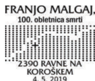
PP KFD 200/2019