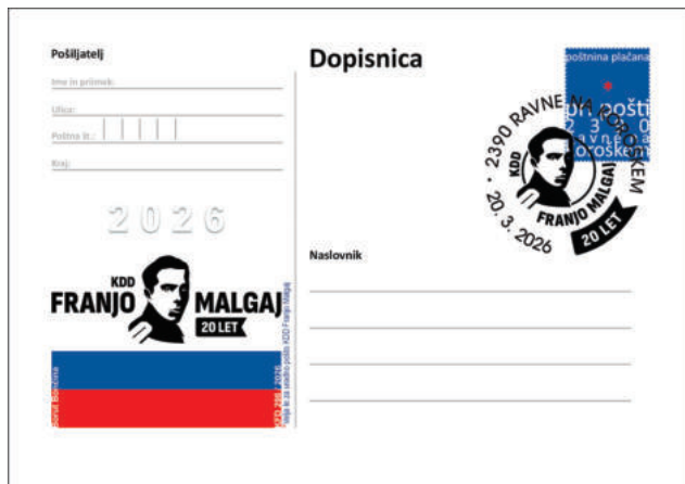
PD KFD 298/2026

V uporabi bo priložnostni poštni žig, izdani bosta dve spominski filatelistični celoti; dopisnica/vabilo in spominski ovitek.