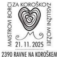
PP KFD 290/2025

Opomba: PP – priložnostni ovitek, PK – priložnostna kartica, PD – priložnostna dopisnica, OPD – ovitek prvega dne