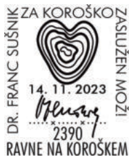
PP KFD 273/2023