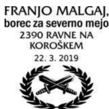
PP KFD 194/2019 PK KFD 195/2019 OPD PS 13/2019