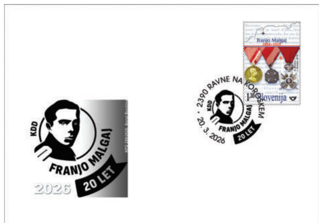
PD KFD 299/2026