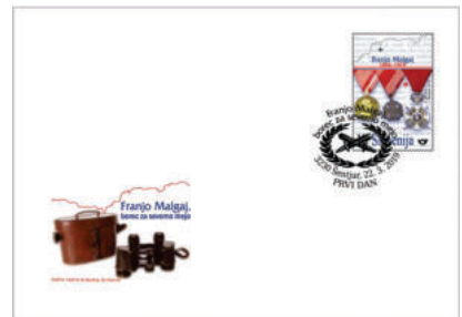
OPD PS 13/2019