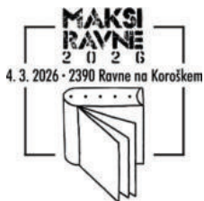
PPŽ1 - 4.3.2026

Motivika priložnostnega filatelističnega sklopa je vpeta v lokalno okolje: knjiga, solzice, Prežih, Ravne.