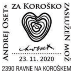
PP KFD 227/2020