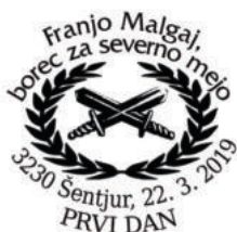
PP KFD 194/2019 PK KFD 195/2019 OPD PS 13/2019