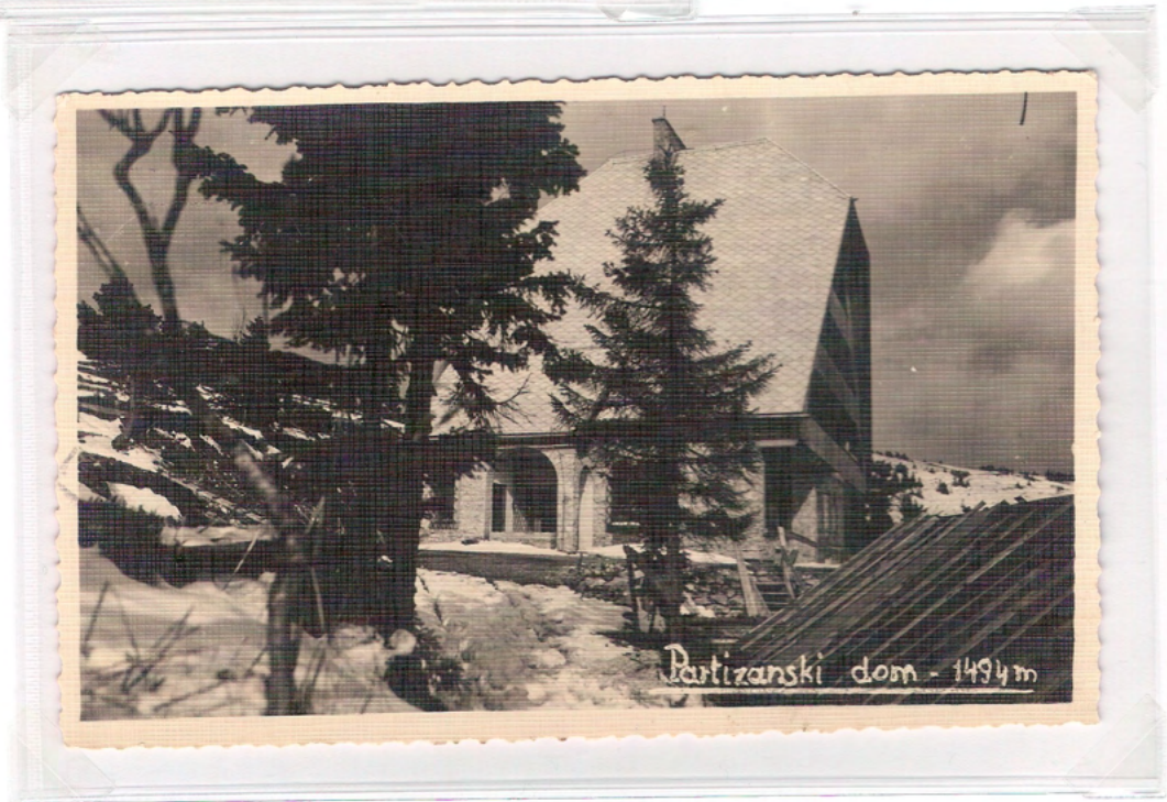
Partizanski dom pod Malo Kopo z zahoda. Datum na hrbtni strani junij 1956, ni bila poslana.

Partizanski dom z vzhoda. Datum na hrbtni strani 3. 5. 1955, ni bila poslana.