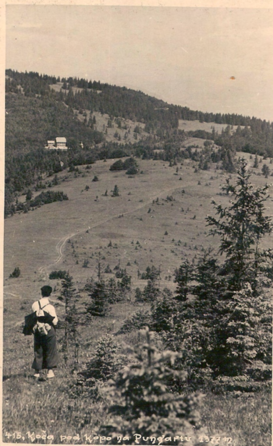
Koča pod Kopo na Pungartu

Na poti s Črnega vrha h Koči pod Kopo na Pungartu. Foto Pečar Mirko, Sv. Pavel p. P., ni bila poslana.