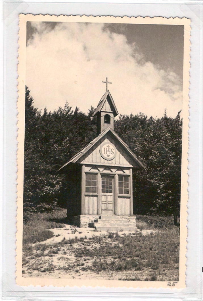
Koča pod Kopo na Pungartu