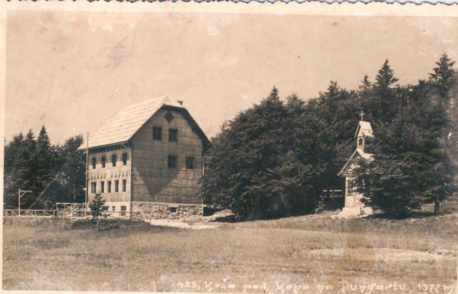
Koča pod Kopo na Pungartu s kapelico sv. Ane.

Na poti s Črnega vrha h Koči pod Kopo na Pungartu.