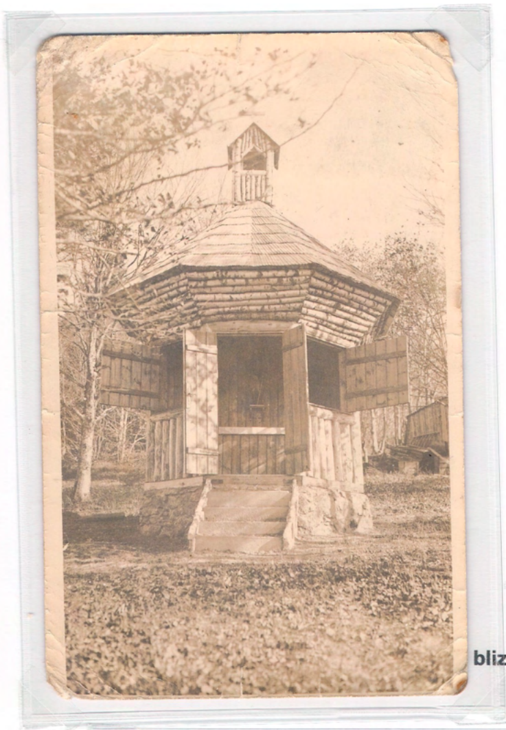
Koča na Kremžarjevem vrhu