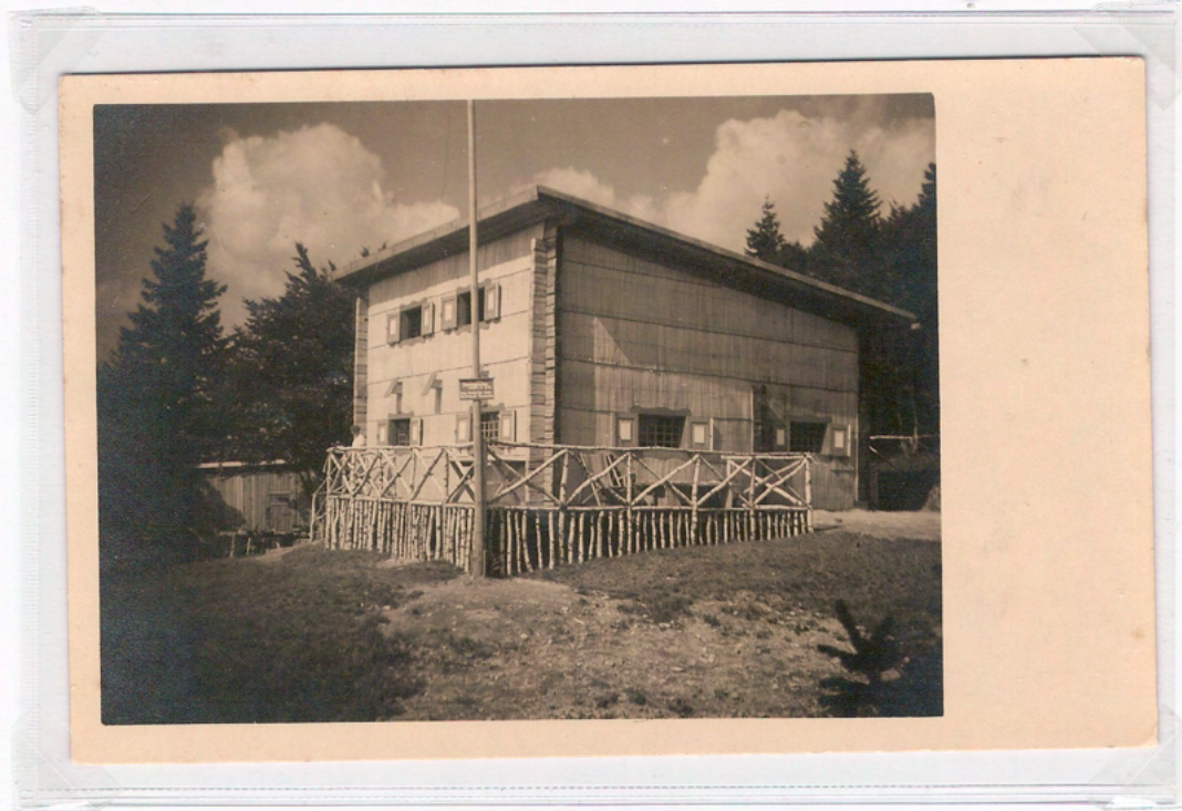
Pogled na kočico z jugovzhoda. Poslana 31. 7. 1939 v Zagreb.