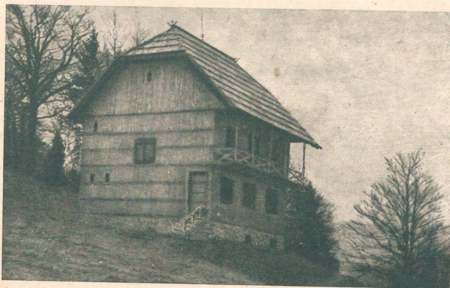
Slovenska koča na Kremžarjevem vrhu leta 1948. Ni bila poslana.