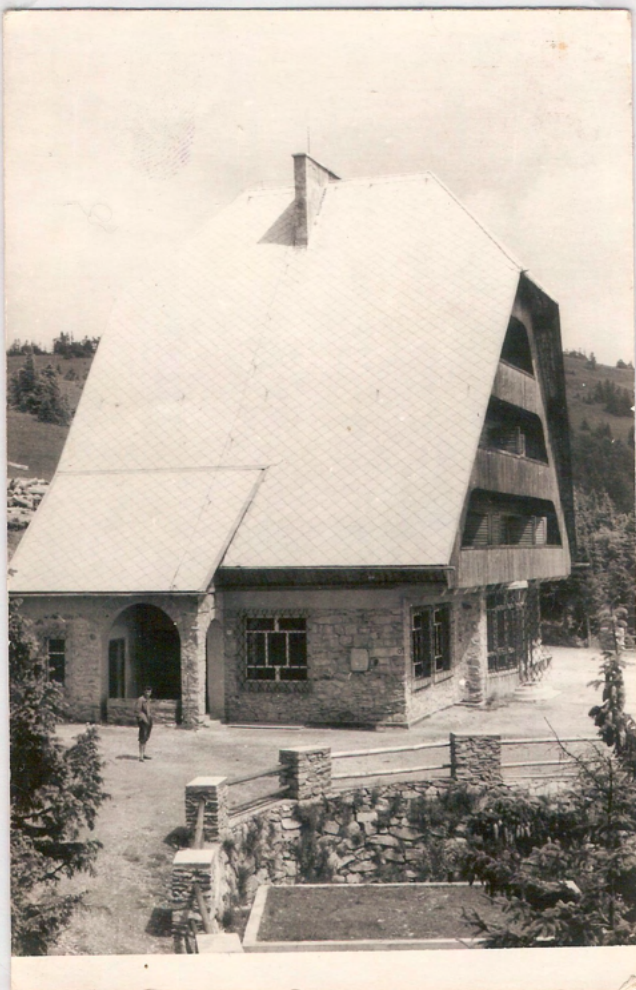
Partizanski dom pod Malo Kopo