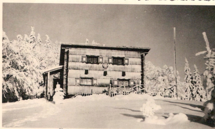
Koča na Kremžarjevem vrhu 1.161 m