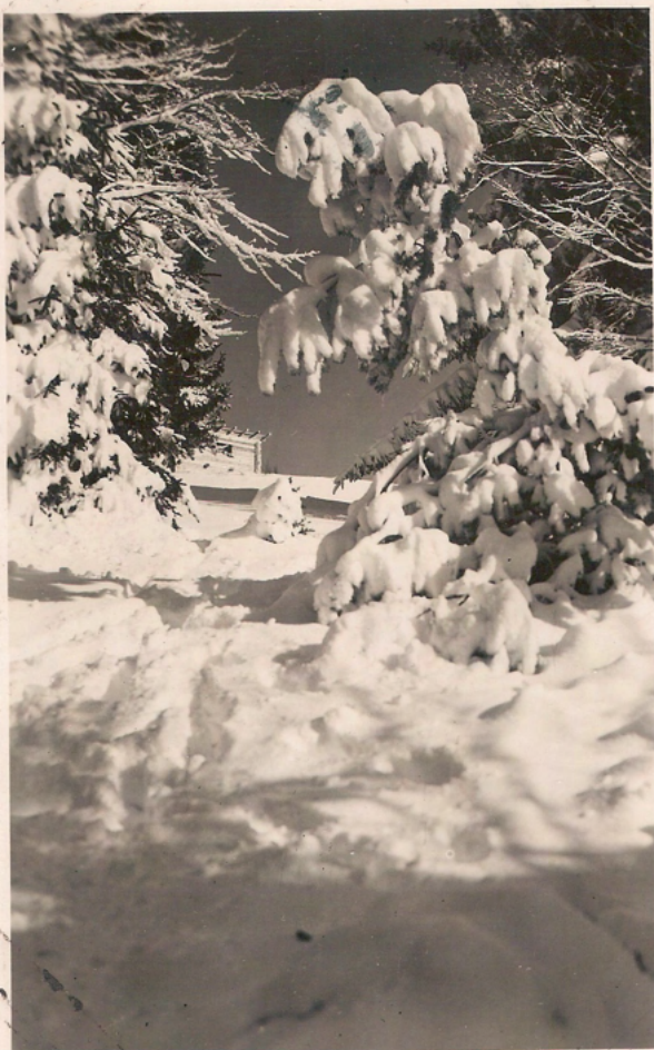
Koča na Kremžarjevem vrhu