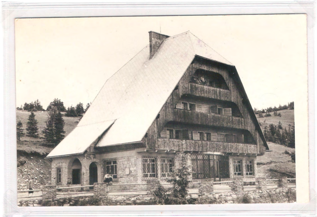
Partizanski dom pod Malo Kopo z okolico. Poslana 30. 10. 1960 v Zagreb.