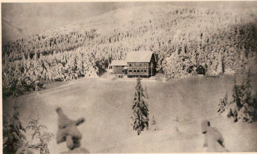
Koča pod Kopo