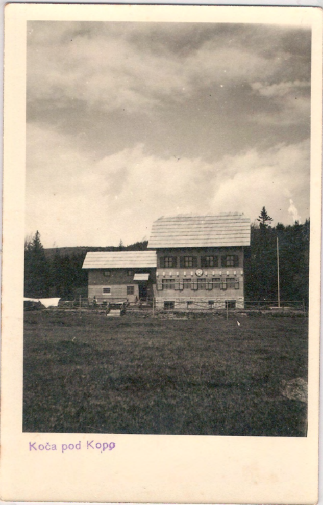
Koča pod Kopo