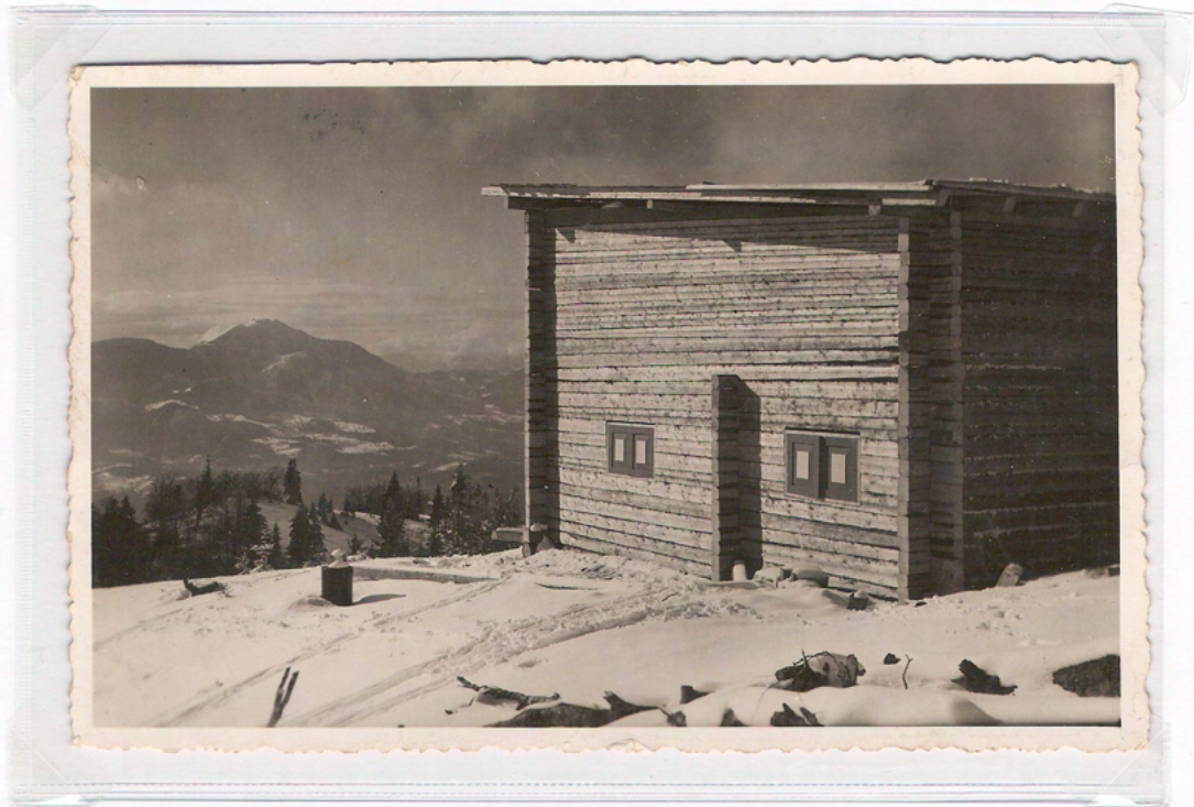
Pogled na vzhodno stran kočice z Uršljo goro v ozadju. Založil zimsko-športni odsek SPD SG, poslana 9. 12. 1934 v Gradec.