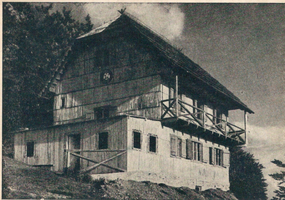
Slovenjgraška koča pod Kremžarjevim vrhom. Datum na hrbtni strani 11. 6. 1950.