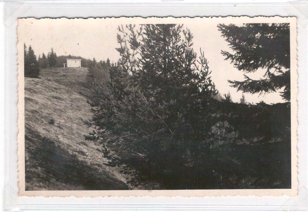
Pogled na kočo z juga. Ni bila poslana.