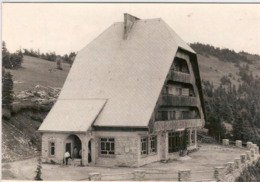
Partizanski dom pod Malo Kopo z okolico. Poslana 16. 9. 1959 v Slovensko Bistrico.