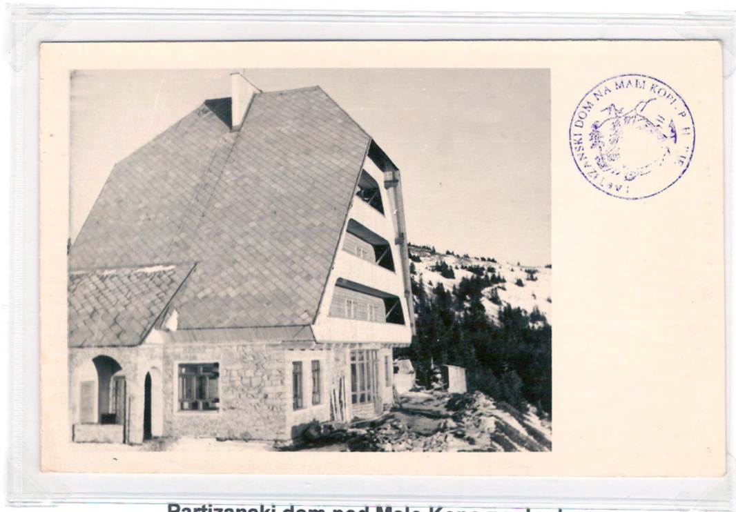
Partizanski dom pod Malo Kopo z zahoda. Na hrbtni strani je napisana letnica 1956, ni bila poslana.