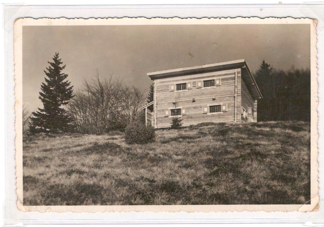
Kočica na Kremžarjevem vrhu.

Po vojni se lastnik zemljišča ni strinjal z gradnjo nove kočice, zato so jo morali postaviti nižje na Kernikov vrh (1102 m), od koder je lep razgled na Mislinjsko dolino in Karavanke. Graditi so jo začeli jeseni 1947 in jo odprli 4. julija 1948. Sprva se je imenovala Slovenska kočica na Kremžarjevem vrhu, kasneje Slovenjgraška kočica pod Kremžarjevim vrhom, zdaj je to Koča pod Kremžarjevim vrhom, s popularnim imenom Kremžarica.