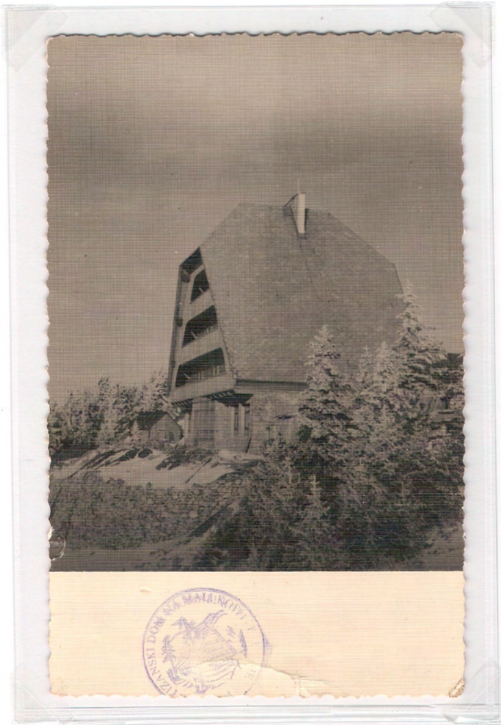
Partizanski dom pod Malo Kopo

Partizanski dom z vzhoda. Datum na hrbtni strani 3. 5. 1955, ni bila poslana.