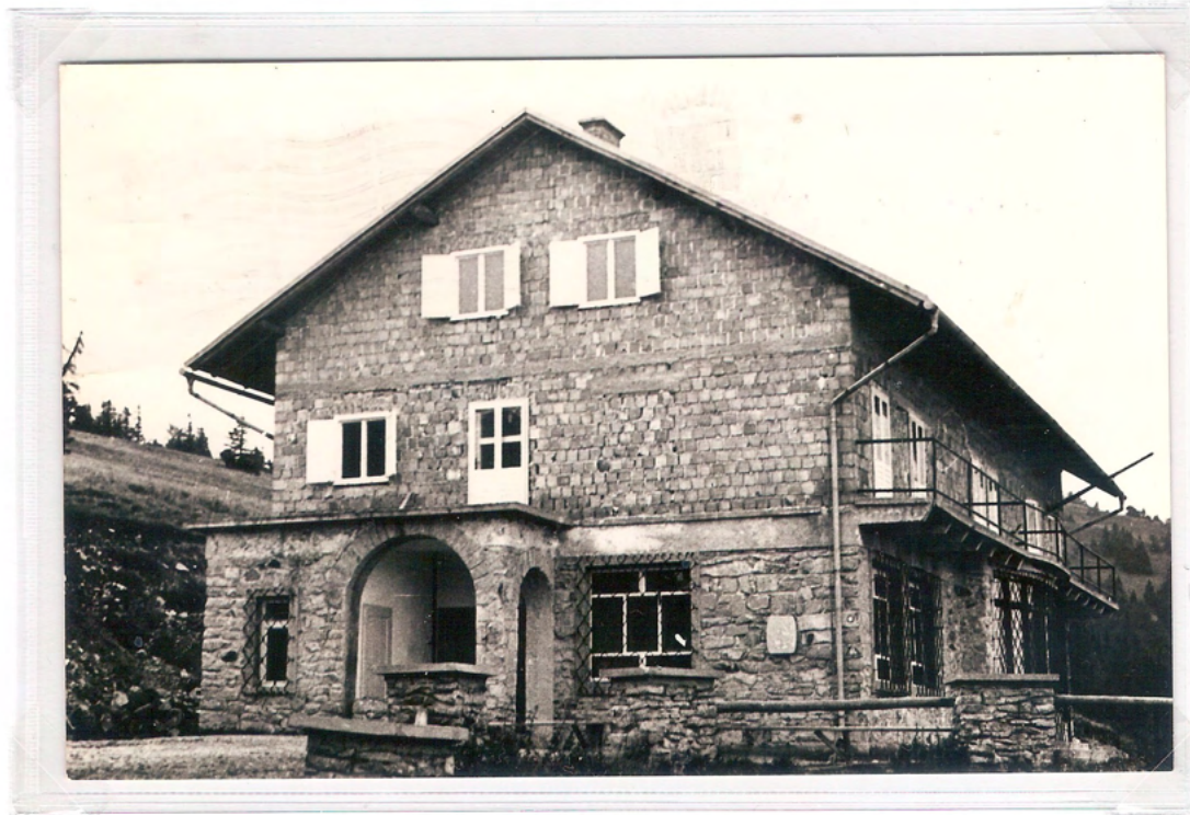
Na novo zgrajeni Partizanski dom pod Malo Kopo. Poslana 11. 4. 1967 v Slovenj Gradec.