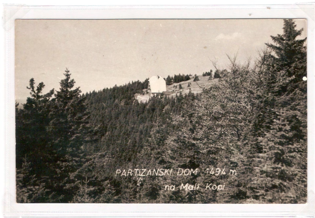
Pogled na Partizanski dom pod Malo Kopo z jugovzhoda. Ni bila poslana.

Dne 1. januarja 1961 je dom pogorel do betonske plošče. Še isto leto so ga začeli obnavljati, vendar je delo zastalo vse do leta 1965. Dokončno so ga uredili leta 1967.