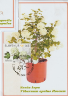
Sečna kopa Viburnum opulus Rosace

Listopadni grm v ločeni kmetiji. Listi so krepki, odzorni hrapavi in jasnji postanejo rdeči. Čveti na konci panjki in v zadnjih položjih. Čveti bele, naraščajo pa so glavčasta. Na pramniku drisko ravnajo in nato. Dobro poznajo vrstno razliko.