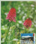
SNEŽNIŠKO CVETJE RDEČA MURKA ( Nigella arvensis )