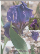
IRISKA PERUNIKA ( Iris sibirica )