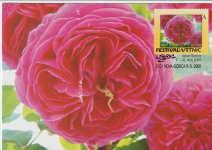
Rosa Blazniki No. 2 iz zbirke vrtnih barbovok v Novi Gorici.