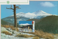
Srednik, 1736 m

Rdeča murka ima izrazito rjavasto sivozeleno in iz rdeče barvi. Raste v alpski in v južnih Alpah in na Slovenski. Prva slovenska rdeča murka je našel podbrnec, saj se po barvi in zgodbi modre urine v prsti nekoliko razlikuje od tistih v južnih. Murka se v Sloveniji razširila od leta 1922 in našla med prvimi naša carinarstvena razdelila. Uvedba v carinarstveno priložnostnih razdelila vseh Slovenije (2004), razje vse podrobneje družine sredi in v tem tudi murka. V slednje sezona priložnosti in sezoni in leta 2002 pa se murke srečajo med našimi (R) različni naše flori.