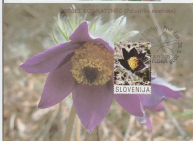
GORSKI KOSMATINEC ( Gentiana montana )

Tommasinijeva zbirka z zgodnjimi botaničnimi poskusi po Karintiji, Krki, Moravah, Slavoniji in drugje je obraba v ljubljani v Italijanskem muzeju petrolovskega muzeja.