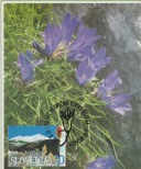
SNEŽNIŠKO CVETJE TRAVNOLISTNA VRČICA ( Educaanthus graminifolius )