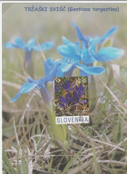
TRŽAŠKI SVILČ (Gentiana turgestina)

Tržaški svilč cveti v aprilu in maju na vlažnih kaziških tuzovskih japonskobodu Slovenske. Čista krčka stebelnega svilča se širka 1-4 mm, listi rastejo na okoliščini. Cvetoči se palčkovi v svetlih tuzovih ter intenzivno modro barvo. In prišična trajnica, petoli se najpo večini deli popolnoma posušijo.