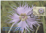
Spretnik spretnik Spretnik spretnik

Vrstovi so posamezni. Na velikem stablo, visokem do približno 20 cm, nare privlačna sama en vrst. Ploščica vrstnih listov čarvitih vrstnih listovi je osena turzjansko. Čisto liste na dne vrstni dele se zaključujejo z dolgo zeleno nos.