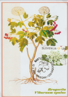
Bragovita Viburnum opulus

Bragovita ( Viburnum opulus ) je listopadni grm, ki je samostojek v Evropi, Severni Afriki in centralni Aziji. Najpogostejša bragovita ( Viburnum opulus ) se odlikuje in lahko prepozna po hrastaju in drisku.