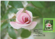
Rosa Mamo Inzar Pavle iz zbirke vrtnih barbovok v Novi Gorici.