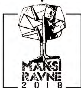
1. 3. 2018 - 2390 Ravne na Koroškem

Komisija je pri svojem delu ugotovila, da nekateri razstavljeni eksponati ne ustrezajo kriterijem za ocenjevanje po nobenem od razstavljenih razredov, zato eksponatov ni ocenila in je predlagala, da se razstavljalcem dodeli diploma za sodelovanje. Sodniška komisija ocenjuje, da je nivo razstavljenih eksponatov dober in da nekaterim manjka le boljša obdelava gradiva, da bi dosegli boljše rezultate. Vse odločitve sodniške komisije so bile sprejete soglasno.