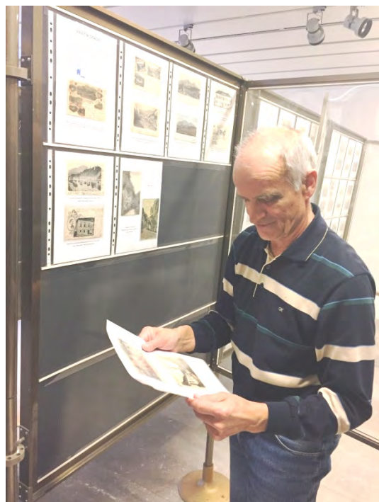
FOTO UTRINKI Z MAKSI RAVNE 2018

Ekspoziti v častnem zboru niso bili ocenjeni.