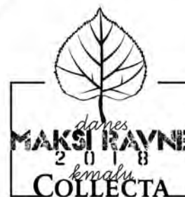
15. 3. 2018 - 2390 Ravne na Koroškem