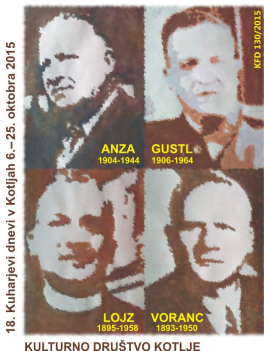
18. Kuharjevi dnevi v Kotljah 6.–25. oktobra 2015