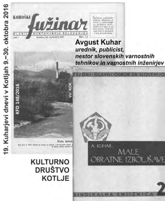
19. Kuharjevi dnevi v Kotljah 9.–30. oktobra 2016