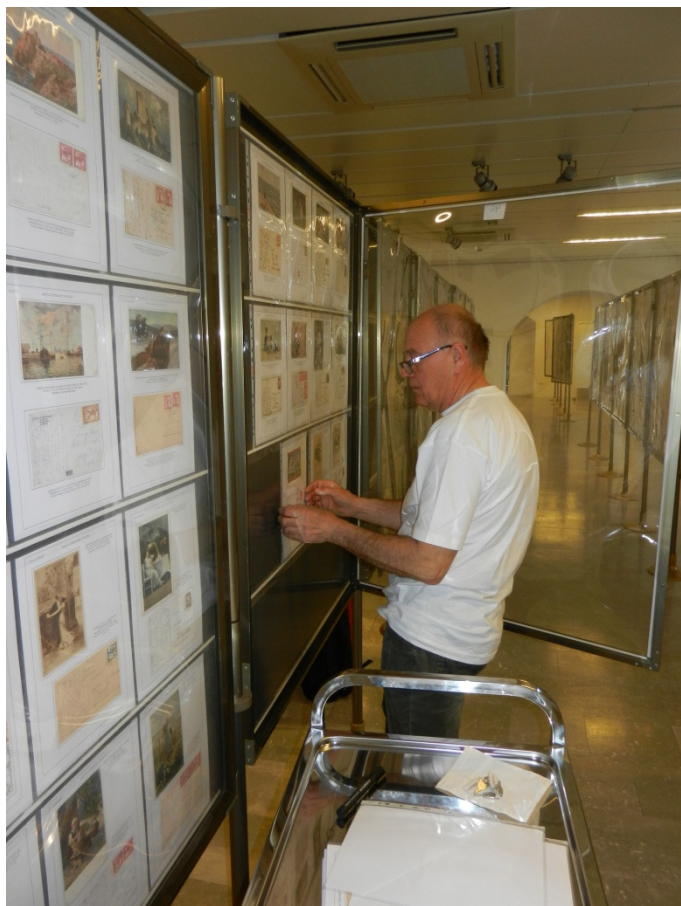
FOTO UTRINKI Z MAKSI RAVNE 2014